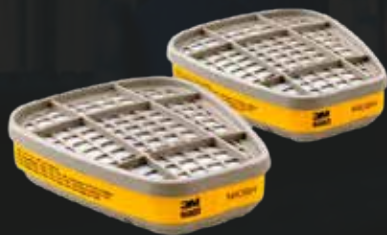
Filtro 6003 para vapores orgánicos y gases ácidos - 3M