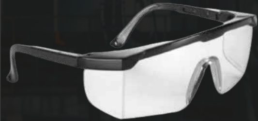
LENTES MODELO SP100 - SEGPRO COLOR: CLARO - OSCURO

Lentes de seguridad de policarbonato. Protege de rayos UV y de impactos de partículas a alta y baja velocidad.