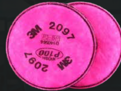
Filtro para particular 2097 - 3M