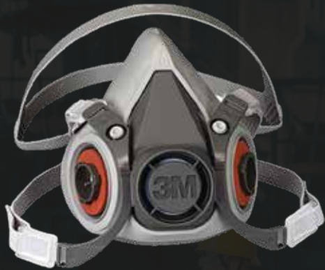
Respirador reutilizable medio rostro, medium 6200 - 3M