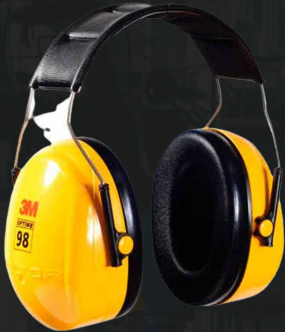
Orejera 3m h10a peltor