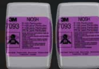
Filtro para Partículas 3M™ P100