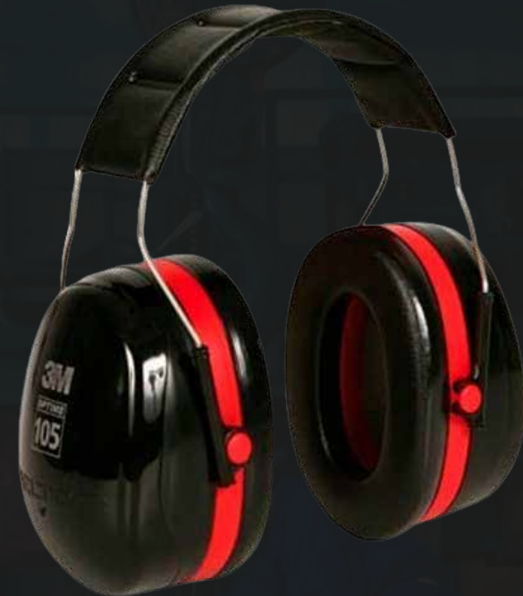
Orejera 3m h10a peltor

Están diseñados para proveer efectiva protección contra ruido cuando se usan de acuerdo con las instrucciones de colocación y se aplican los criterios para la selección de equipos de protección auditiva.