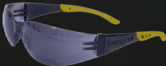
LENTES MODELO SP300 - SEGPRO COLOR: CLARO - OSCURO