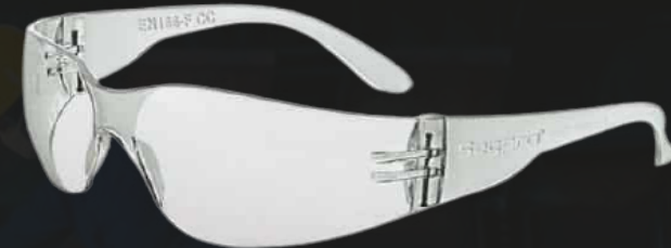
LENTES MODELO SP200 - SEGPRO COLOR: CLARO - OSCURO